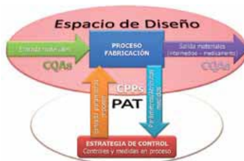
Figura 1: Espacio de diseño

En un entorno QbD, no solamente es importante definir con exactitud el perfil de calidad del producto a través de sus especificaciones. Lo que es fundamental es definir las condiciones de proceso a través de los CPPs, y los requerimientos de calidad de los materiales de entrada al mismo mediante los CQAs, que conducen a obtener el producto de la calidad deseada. La combinación de los CPPs y CQAs que cumplen esta condición es lo que se ha venido a llamar "espacio de diseño".