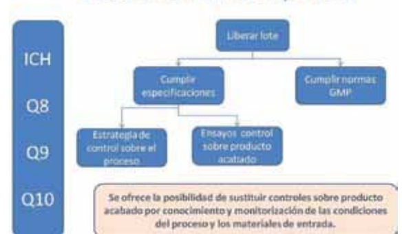
Figura 2: Liberación en tiempo real.

ron trabajando sobre un caso práctico de planteamiento de un RTRT. El objetivo es la formación y la difusión de estas aproximaciones a la comunidad científica.