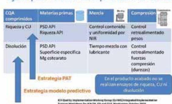
Figura 3: Ejemplo de estrategia de control con RTRT.