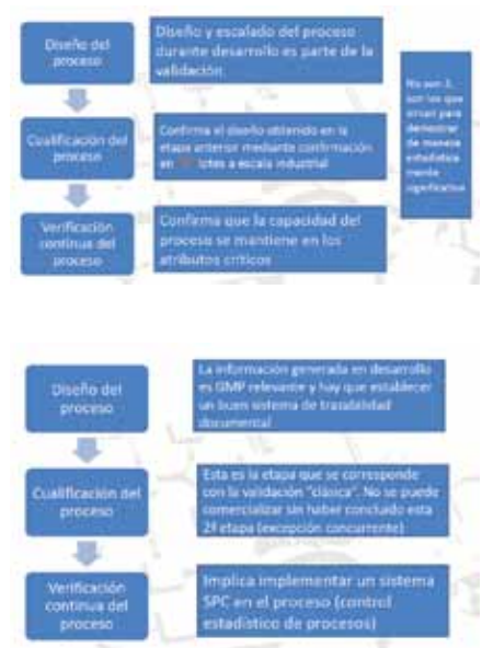
Figs. 1 y 2. Guía FDA validación procesos 2008.

La propuesta de validación de procesos de la nueva guía se presenta de manera esquemática en las Figuras 1 y 2.